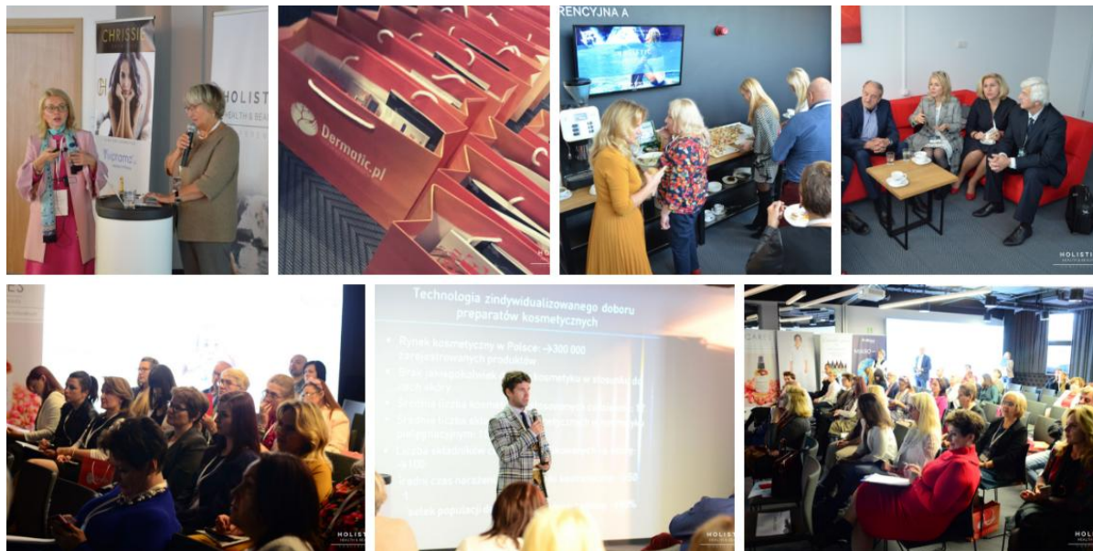
Zdjęcia z I Międzynarodowej Konferencji Naukowej Holistic Health&Beauty Conference